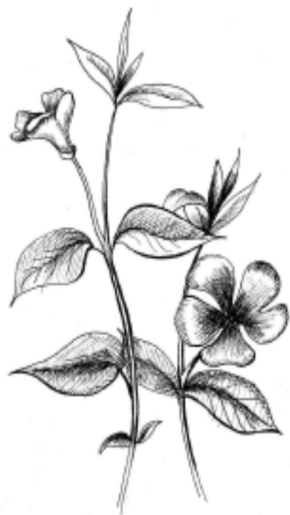
Рис. 7. Барвінок / Vinca

Барвінок у народній традиції є уособленням радісної життєвої сили, вічності усталеного буття, невмирущості, пам'яті про покійних, цнотливості. В інтер'єрі української хати «активувалася» його викривальна здатність: у народі вірили, що вінок із барвінку над вхідними дверима допоможе виявити відьму [12, 20].