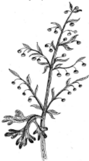
Рис. 4. Полин / Artemisia

Магічними властивостями наші предки наділяли й трав'янисті рослини. Їх використовували як амулети, розвішуючи навколо дверей, вікон, адже, за народними уявленнями, саме отвори в цілісній конструкції споруди можуть стати шляхом для входу зовнішніх ворожих до людини демонічних сил. Важливе значення мала символіка рослинного орнаменту внутрішнього та зовнішнього настінного розпису та вишивок, що прикрашали рушники та інші деталі інтер'єру. Добираючи рослини для квітника – обов'язкового складника традиційного українського обійстя – враховували не тільки естетичні або лікувальні властивості рослин, важливо було наповнити двір квітами, травами, деревами з певними магічними функціями, щоб гарантувати здоров'я, спокій та добробут мешканцям.