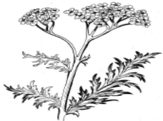
Рис. 6. Материнка / Origanum

Цибуля – символічний оберіг і активний життєвий оборонець людини від всяких напастей та недугів. Підвішені під хатньою стелею вінок чи коса цибулі очищали повітря. Цибуля вважалася чудодійними ліками, яким приписувалася магічна цілюща сила [10].