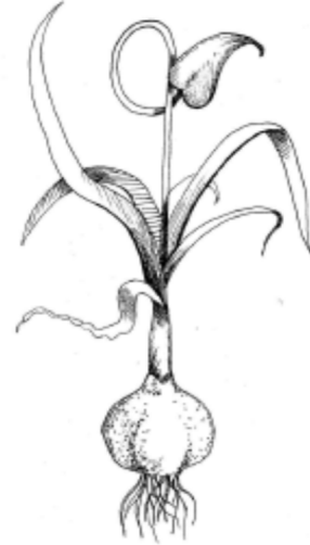
Рис. 5. Часник / Allium sativum

Часник є символом місяця – форма зубчиків нагадує серп місяця-молодика, – тому силу часнику ніби запозичено від внутрішньої сили місяця, що має вплив на землю і все живе на ній. Через те часник був символом родючості та здоров'я. Його вважали дезінфекцією проти епідемічних недугів, а також використовували як амулет від нечистої сили [10].