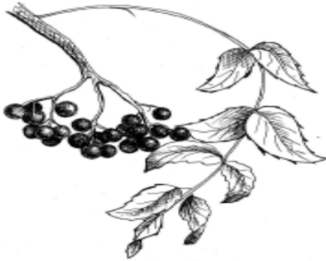
Рис. 3. Горобина / Sorbus

Крім калини, у багатьох обрядах часто використовувалася горобина . Як оберіг її садять біля хати. Колись на Купайла гілочки горобини чіпляли на кожні двері, щоб уберегтися від злих духів та хвороб. Гілочка горобини має 13 листочків. Це магічне число богині Луни (Місяця) – захисниці жінок. Вірили, що горобина захищає від блискавки.