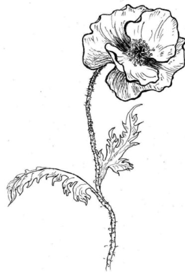
Рис. 1. Польовий мак / Papaver rhoeas

За світоглядними уявленнями українців особливою чудодійною силою наділявся мак. Польовий мак (мак-видюк) – головний о беріг від лиходійства відьом, упирів та бісівської погані. Він, як і будь-який елемент оздоблення, поєднував у собі дві якості: як оберіг і як краса, адже мак вважався символом краси. Маків цвіт прирівнюється до швидкоплинного людського життя та до голови роду – матері. Порівняння маку з матір'ю є особливо символічним, бо органічно вписується в прадавній культ жінки-матері – охоронниці домашнього вогнища. Цей архаїчний культ досить міцно зберігався серед українців і у XVII – XVIII ст., виявляючись, зокрема, в тому, що саме жінка оздоблювала свою оселю.