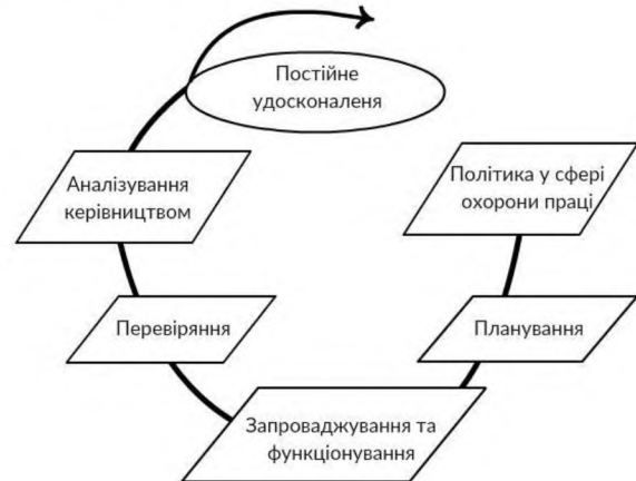
Рис. 2. Загальна модель СУОП підприємств електроенергетики / Total model of safety management in electroenergy companies

Згідно з [5] СУОП підприємств електроенергетики (рис. 2) будується на основі поширеної в країнах Євросоюзу методології, відомої як «Плануй-Виконуй-Перевірй-Дій» та відповідає вимогам ДСТУ ОHSAS 18001:2010.