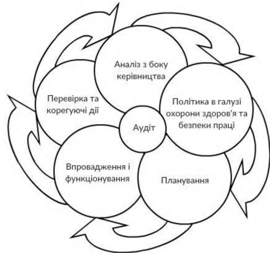
Рис. 4. СУОП за версією OHSAS / Safety management according OHSAS

Блок «Впровадження і функціонування» містить розробку структури і відповідальність, консультування та комунікацію, управління документами та даними, управління операціями, підготовленість до аварійних ситуацій та реагування на них.