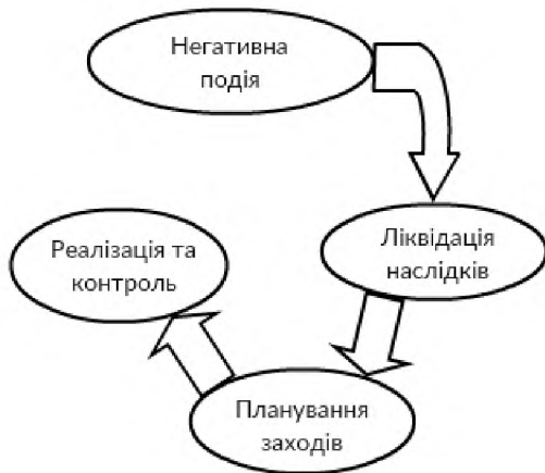
Рис. 1. Схема функціонування системи управління охороною праці / Scheme of operation safety management

Як приклад, на рис.1 представлена у загальному вигляді схема функціонування системи управління охороною праці на підприємствах залізничного транспорту.