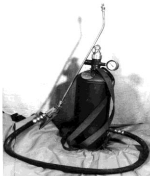
Рис. 2. Балонні аерозольні генератори / Bottle aerosol generators

Переваги аерозольної технології знезараження: дозволяє економне використовувати робочі речовини;