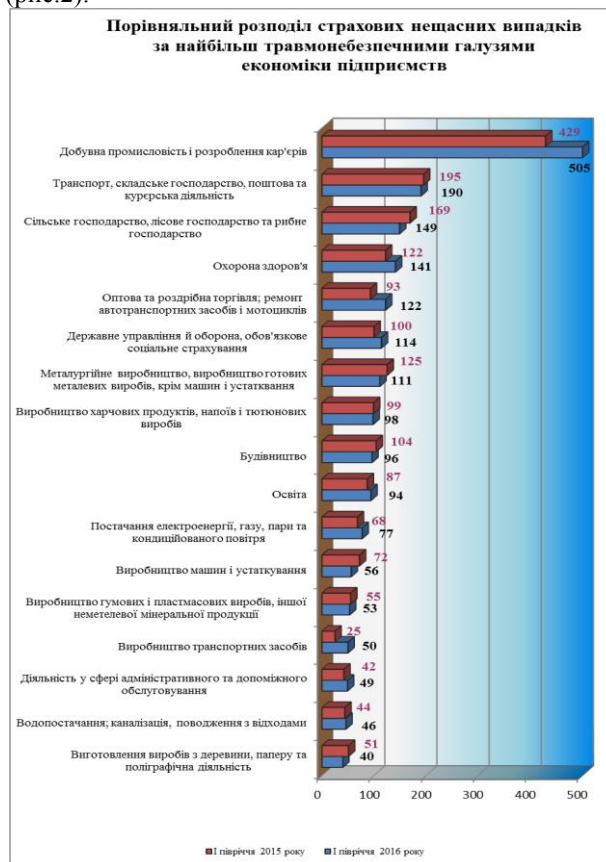
Рис. 2. Порівняльний розподіл страхових нещасних випадків за найбільш травмонебезпечними галузями економіки підприємств / Comparative distributing of

Значно збільшилась кількість страхових нещасних випадків із смертельним наслідком у: Волинській області - на 8 випадків, або у 3,7 разів (з 3 до 11), Рівненській та Черкаській областях - на 6 випадків, або у 7 разів (з 1 до 7), м. Києві - на 5 випадків, або 71,4% (з 7 до 12). Значне зниження страхових нещасних випадків відмічається у: Закарпатській області - 45,0% (з 20 до 11), Івано-Франківській області - на 30,8% (з 39 до 27), Чернігівській області - на 22,2% (з 63 до 49), Сумській області - на 19,0% (з 58 до 47) (рис.2).