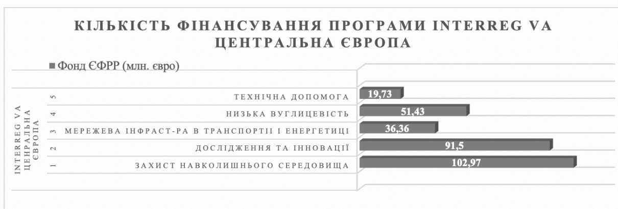
Рис.4 Кількість фінансування програми Interreg VA Центральна Європа на період 2014-2020 рр.

Задля аналізу ефективності програм у втіленні в життя цілей сталого розвитку, проглянемо показники СР, у вибраних країнах-нових членах ЄС які класифіковані за 17 цілями стратегії, які носять комплексний і неподільний характер і забезпечують збалансованість всіх трьох компонентів сталого розвитку: економічного, соціального та екологічного (табл.2,3) та згрупуємо їх за результатами шляхом кластерного аналізу (рис.5 ) [9,10].