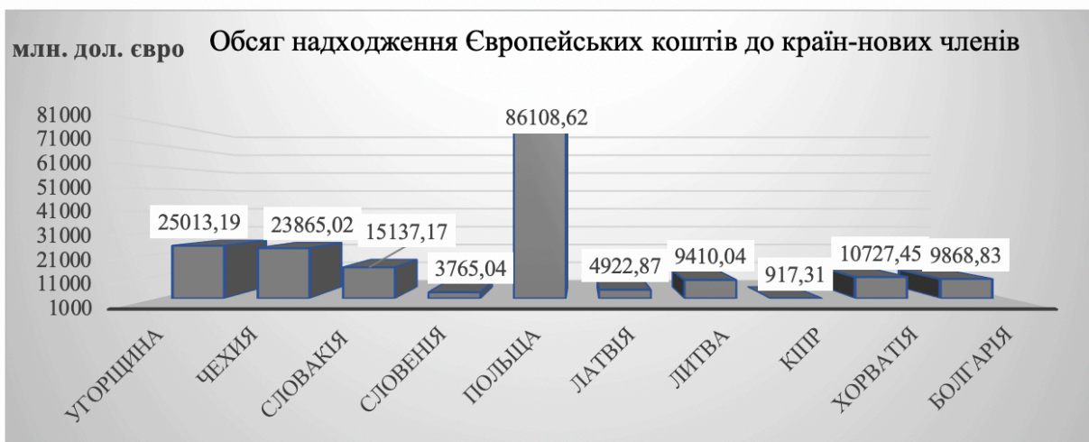
Рис. 3 Структура фінансування країн-нових членів ЄС європейськими коштами структурних та інвестиційних фондів на період 2014-2020 рр.

Аналізуючи данні можливо зазначити, що у обраних нами країнах 70-80% фінансування забезпечується європейськими структурними та інвестиційними організаціями. Найзначнішим одержувачем коштів ЄС залишається Польща, при цьому сума фінансування в рамках нового періоду для Польщі зросла до 97,9 млрд євро, значно збільшився рівень фінансування Болгарії (до 11,7 млрд євро), Хорватії (до 12,6 млрд євро), Словенії (до 5 млрд євро). На сьогодні фінансову допомогу вже отримали такі програми сталого розвитку, як Interreg, URBACT III.