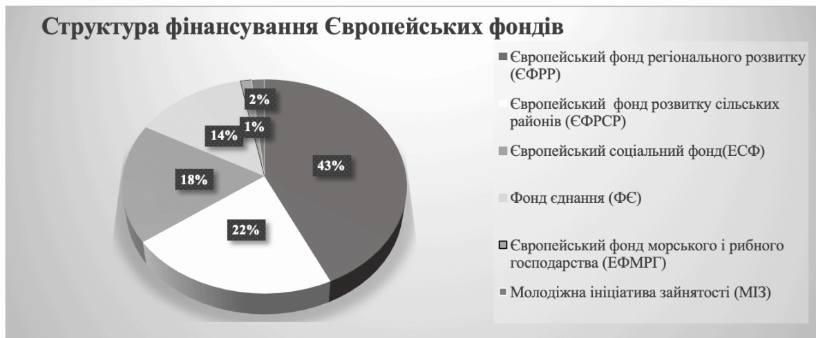
Рис. 2 Діаграма структури фінансування європейських фондів

стихийні лиха, є вираженням європейської солідарності з постраждалими від лих регіонами Європи. На сьогоднішній день підтримка була надана 24 різних європейських країн на суму понад 5 мільярдів євро [4]. У таблиці 1 розглянемо структуру фінансування європейських фондів десяти обраних нами для дослідження країн взагалі та окремо Європейським Союзом, користуючись рис.3.