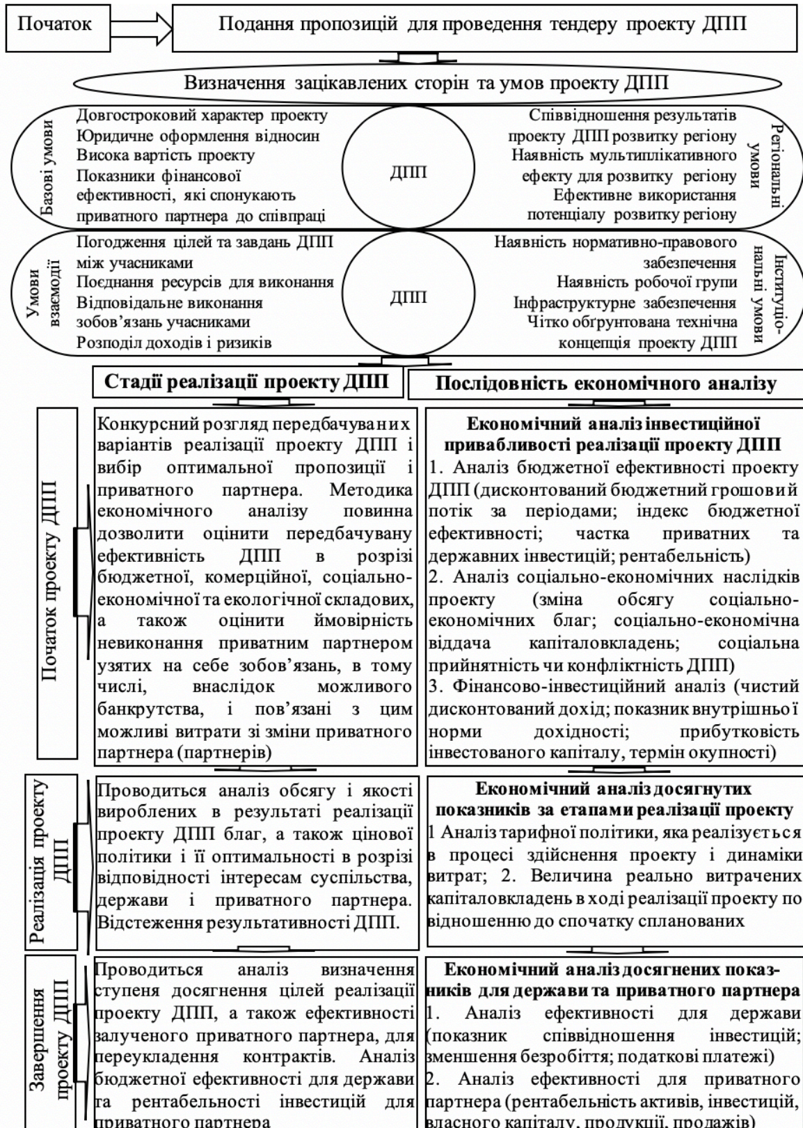
Рис. 2 Концептуальна модель економічного аналізу реалізації ДПП