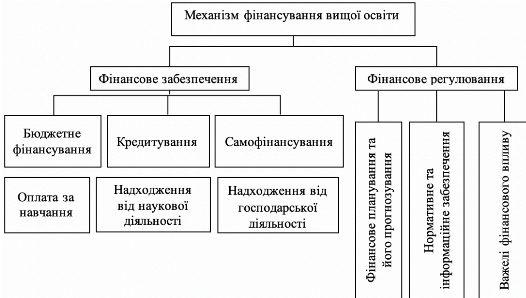
Рис. 1 Механізм фінансування вищої освіти України

Наведений механізм є прикладом функціонування двох важливих підсистем: