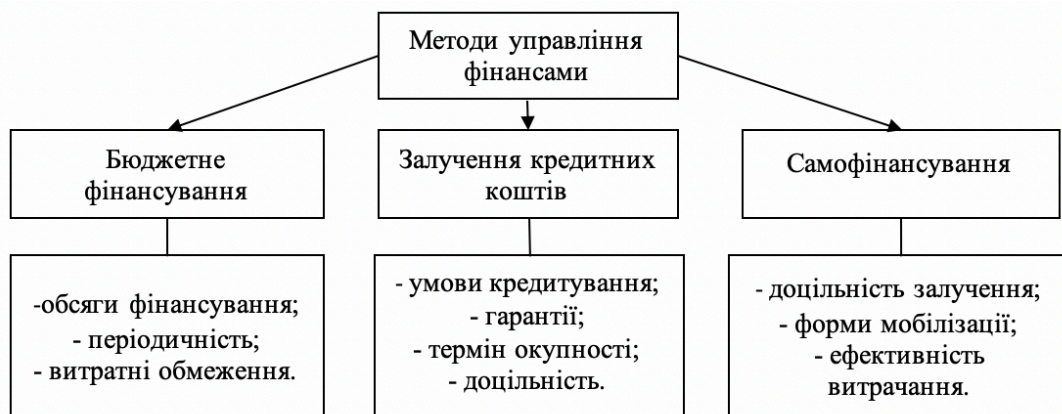
Рис. 2 Методи управління фінансовими ресурсами закладів вищої освіти