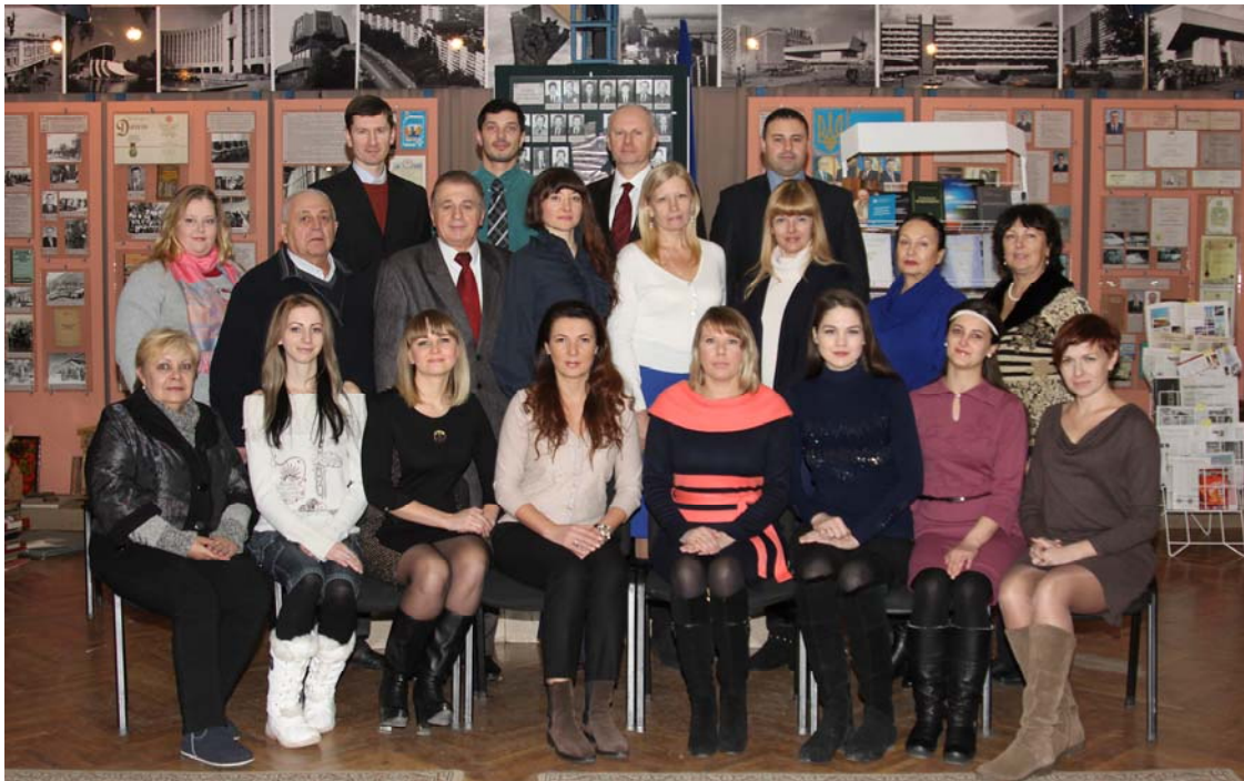
Професорсько-викладацький склад кафедри планування та організації виробництва

Сьогодні кафедра планування та організації виробництва має сильний та злагоджений професорсько-викладацький колектив (рис. 6).