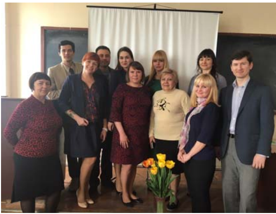
Кафедра планування та організації виробництва на науково-практичній конференції «Організація будівництва і реконструкції промислових та цивільних будівель», (2016)

У 2016 році кафедра планування та організації виробництва провела науково-практичну конференцію «Організація будівництва і реконструкції промислових та цивільних будівель», у якій брали участь зокрема і студенти факультету промислового та цивільного будівництва і будівельного факультету ДВНЗ ПДАБА.