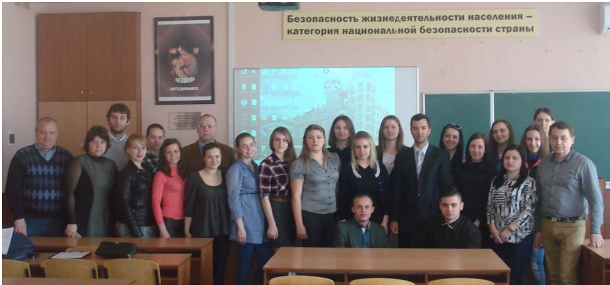
Студентська конференція «Безпека життєдіяльності в XXI столітті», жовтень 2016 р., ПДАБА