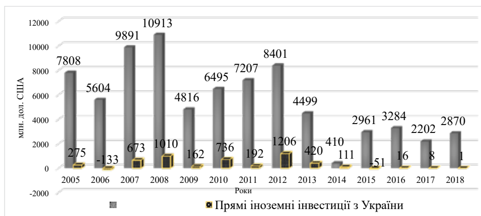
Рис. 1. Динаміка надходження/вкладення прямих іноземних інвестицій в економіку України та з України впродовж 2005–2018 рр., млн дол. США

Основними інвесторами України у 2018 році, на яких припадає 83% від загального обсягу інвестицій, залишилися 10 країн-інвесторів (табл. 1). Список лідерів, які раніше, очолює Кіпр – 8932,7 млн дол. США, Нідерланди – 6395,0 млн дол. США, Велика Британія – 1944,4 млн дол. США, Німеччина – 1682,9 млн дол., Швейцарія – 1515,9 млн дол. США, Віргінські острови (брит.) – 1358,4 млн дол. США, Австрія – 1038,8 млн дол.