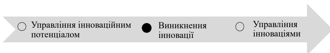
Рис. 2. Співвідношення понять «управління інноваційним потенціалом» та «управління інноваціями»