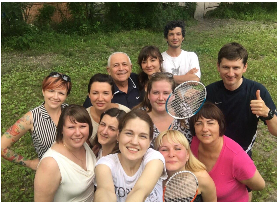
Кафедра планування та організації виробництва під час активного відпочинку (2017)