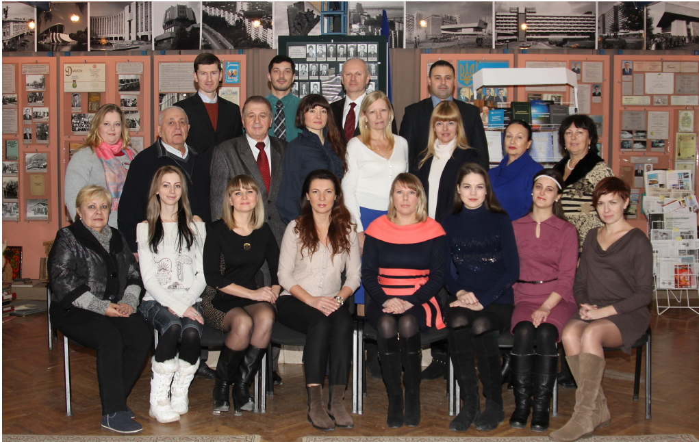
Професорсько-викладацький склад кафедри планування та організації виробництва (2019)

Секрет успіху кафедри протягом багатьох десятиліть полягає у спадковості традицій і принципів науково-дослідницької та науково-педагогічної діяльності, що закладалися в період керівництва кафедрою професором Р. Б. Тяном, які продовжував його учень і послідовник професор В. М. Кірнос, а сьогодні розвиває професор Т. С. Кравчуновська.