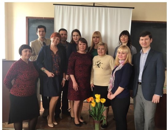
Рис. 4. Кафедра планування та організації виробництва на науково-практичній конференції «Організація будівництва і реконструкції промислових та цивільних будівель»

За ініціативи завідувачів кафедри організовувались міжнародні науково-практичні конференції: «Технологія та організація реконструкції промислових підприємств» (1985 р.), «Проблеми реконструкції та експлуатації промислових і цивільних об'єктів» (1999 р.), «Проблеми організації та управління житлово-комунальним господарством» (2002 р.), «Організаційно-технологічні та економічні аспекти управління в сучасних умовах» (2008 р.), «Проблеми будівельної галузі в сучасних умовах» (2010 р.).