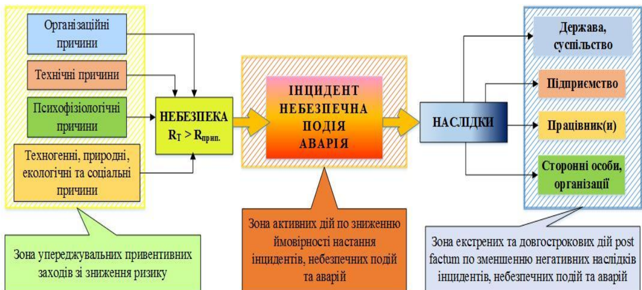
Рис. 1. Схема розвитку небезпечної події від формування небезпеки до прояву її наслідків та зони впливу на них

Також слід зауважити, що ризики генерують різні наслідки, які не завжди будуть негативними, а за деяких обставин створюють супутні можливості у сфері охорони здоров'я і безпеки праці (ОЗіБП) [6]. У цьому документі, коли використовують термін «ризик й можливості», він означає ризик у сфері ОЗіБП, можливості у сфері ОЗіБП, а також інші ризики для відповідної системи управління й інші можливості для цієї ж системи.