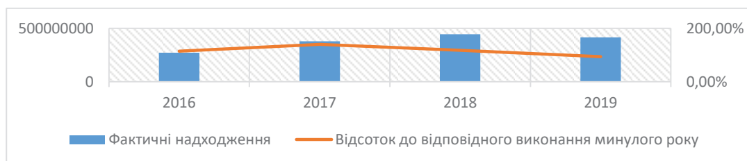
Рис. 2. Сума офіційних трансфертів до бюджету міста Ірпінь за 2016–2019 рр., грн., %

Як видно з рис. 3, видатки протягом 2016–2019 рр. мають тенденцію до збільшення. За уточненого плану на 2019 р. по видатках загального фонду 755 210 748,71 грн