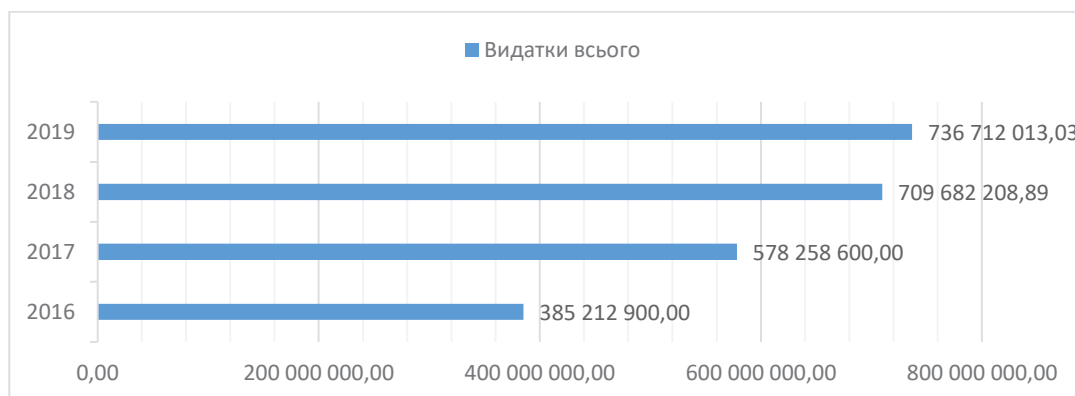
Рис. 3. Видатки загального бюджету міста Ірпінь за 2016–2019 рр., грн