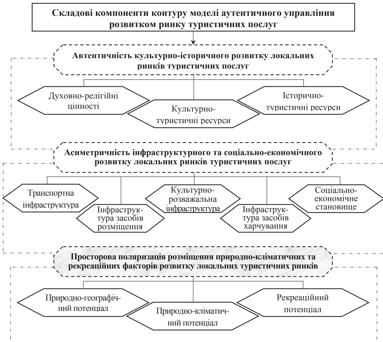
Рис. 1 Складові компоненти контуру моделі автентичного управління розвитком ринку туристичних послуг

Реалізацію моделі необхідно здійснювати на засадах урахування автентичності культурно-історичних ресурсів локальних ринків туристичних послуг, асиметричності інфраструктурного та соціально-економічного розвитку ринків, просторової поляризації розміщення природно-кліматичних та рекреаційних факторів розвитку місцевих туристичних ринків. Синтетична взаємодія зазначених векторів управління утворює контурний каркас моделі, визначає інтегровані компоненти забезпечення конкурентних переваг та деструктивні детермінанти формування локальних туристичних ринків (рис. 1).