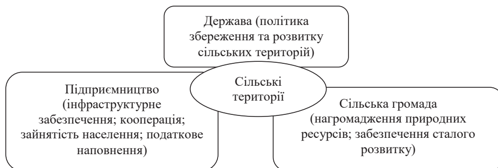
Рис. 2. Компонентна модель економічного розвитку сільських територій