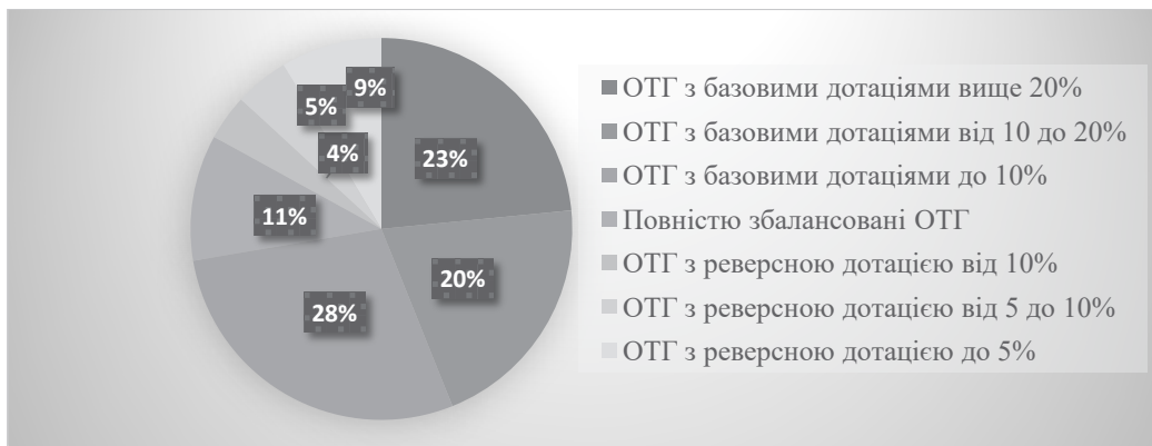
Рис. 1. Структура ОТГ за збалансованістю їхніх бюджетів