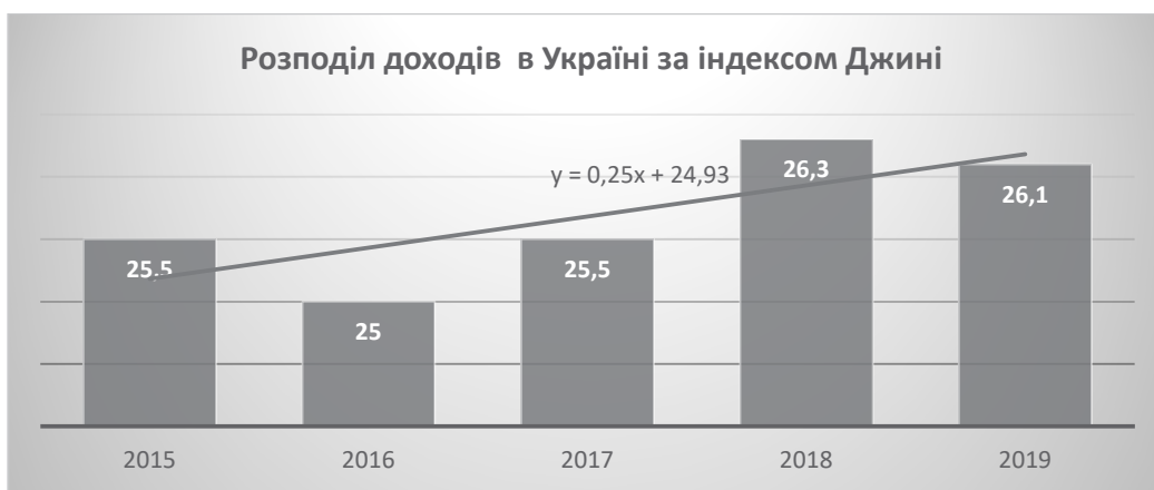
Рис. 2. Динаміка розподілу доходів в Україні за період 2015–2019 рр.