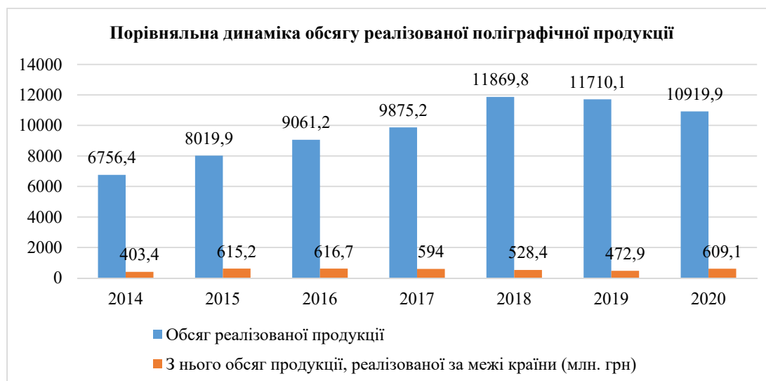
Рис. 3. Динаміка обсягу реалізованої поліграфічної продукції в період із 2014 по 2020 р. (Код за КВЕД-2010 / Code of СТЕА-2010 С 18.1)