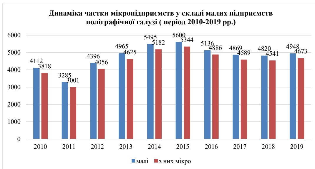
Рис. 2. Динаміка частки мікропідприємств у структурі малих підприємств поліграфічної галузі в період із 2010 по 2019 р. (Код за КВЕД-2010 / Code of СТЕА-2010 С 18.1)