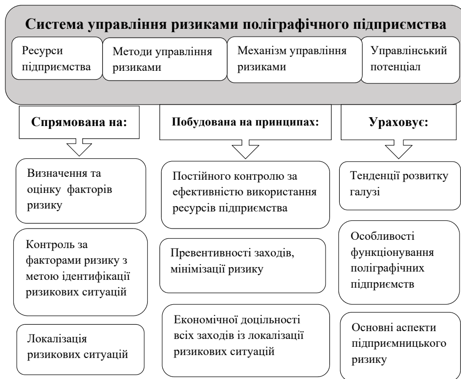
Рис. 4. Основні аспекти системи управління ризиками поліграфічного підприємства