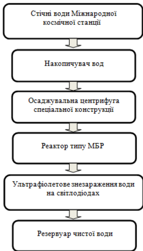
Рис. 4. Технологічна схема очищення стічних вод на Міжнародній космічній станції

центрифуги спеціальних конструкцій [14; 15]. Для очищення вод від розчинених речовин ми пропонуємо реактори, а точніше, мембранні біореактори нового покоління.