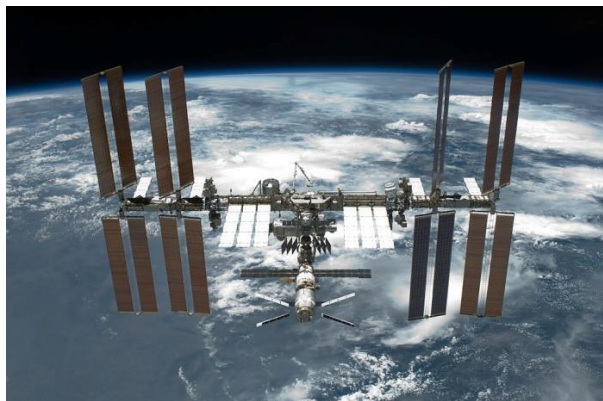
Рис. 1. Міжнародна космічна станція

Постановка проблеми. Міжнародна космічна станція (МКС) – постійна науково-дослідна лабораторія в космосі, плід праці понад 100 000 чоловік. Більшість із них працює в Канаді, Росії та Сполучених Штатах Америки, решта – у Бельгії, Бразилії, Великобританії, Німеччині та інших країнах. Після закінчення будівництва (2004 р.) довжина МКС склала 88 м, ширина – 109 м, а за об'ємом житлових і робочих приміщень станція порівнялася з двома реактивними лайнерами «Боїнг-747». Вага цієї споруди – близько 520 т (рис. 1) [1].