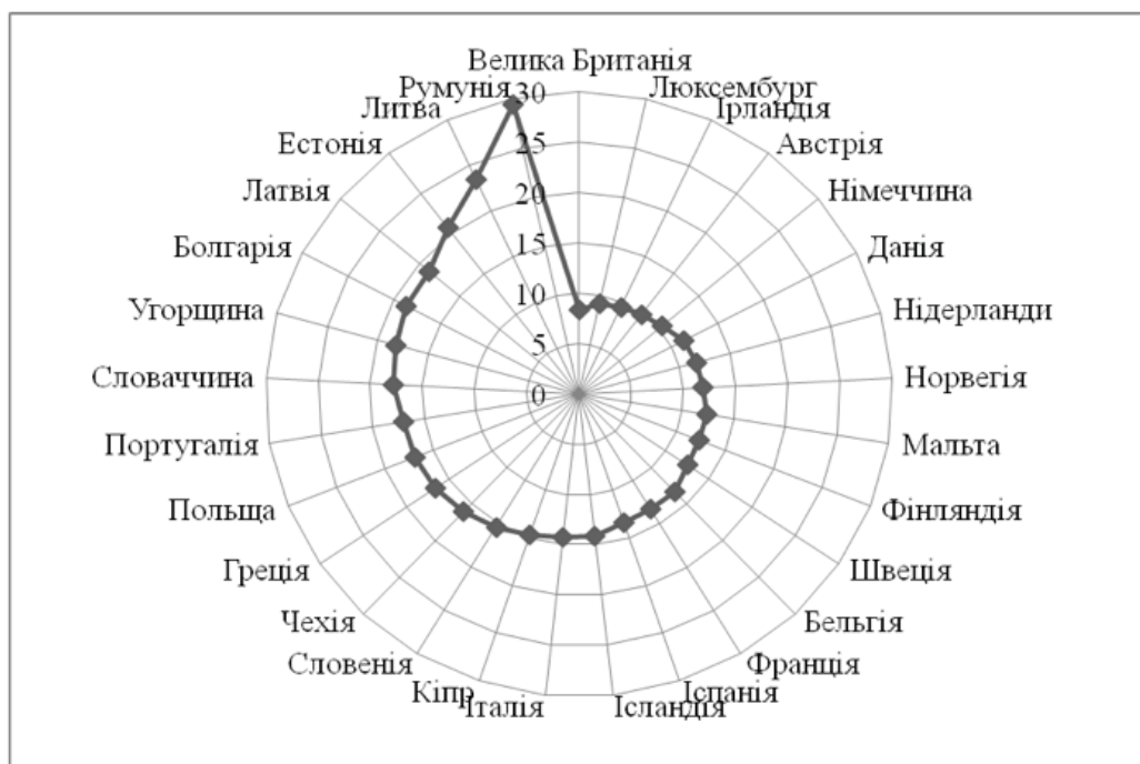
Рис. 3. Частка витрат на продукти харчування та безалкогольні напої у загальному обсязі сукупних витрат домогосподарств у країнах Європи у 2015 році Джерело: [16]

Таке значення є дуже високим. По-перше, воно є значно вищим, аніж у інших європейських країнах (рис. 3). А по-друге, зважаючи на той факт, що 50 % – це середнє значення, слід розуміти, що значна частина населення може спрямовувати на харчування понад 60 % своїх сукупних витрат. Подібна структура витрат свідчить про неспроможність України забезпечити гідний рівень життя вагомій частині своїх мешканців.