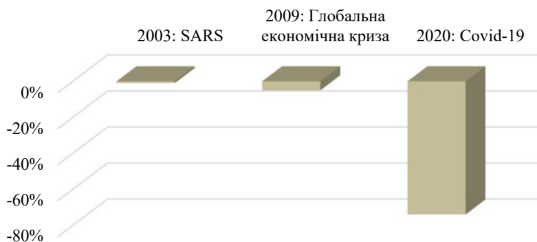
Рис. 1. Втрати міжнародної туристичної індустрії у 2003, 2009, 2020 роках