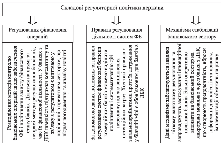
Рис. 2. Регулювання політики держави з використанням адміністративного ресурсу Складено автором на основі [1,8]

Під час вивчення змісту державної політики щодо регулювання банків важливим є своєчасно позначити дані на рис. 2. основні складові, які впливають безпосередньо на стабільну діяльність банківського сектору та докорінно відрізняються від ринкових модифікованих продуктів.