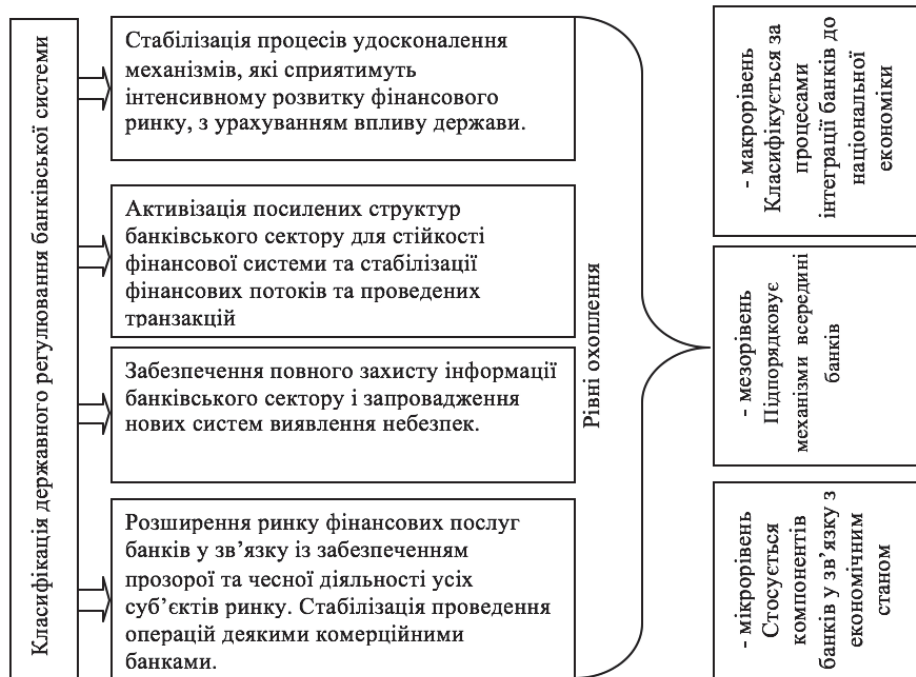
Рис. 1 Класифікація державного регулювання банківської системи Складено автором на основі [5,8]

Стабілізація банку з ДБК в рамках реінжинірингу при використанні адміністративного ресурсу не може бути ефективною у разі якщо: