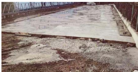
Рис. 1. Бетонне дорожнє покриття паркувального майданчика під час його влаштування