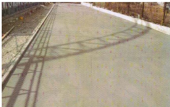
Рис. 2. Бетонне дорожнє покриття паркувального майданчика після завершення робіт