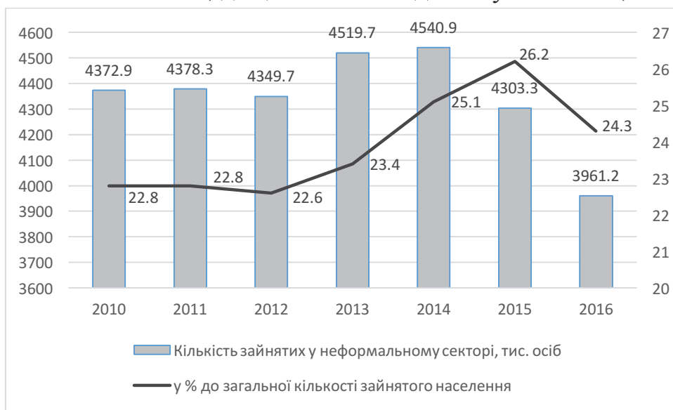
Рис. 1. – Зайнятість населення України у неформальному секторі економіки

При більш детальному дослідженні ситуації по регіонах України (рис. 2), можна побачити, що найгірша ситуація склалася у сільськогосподарських та прикордонних областях, які межують з іншими державами. Серед таких областей: Херсонська (45,1%), Закарпатська (47,3%), Рівненська (49,4%), Чернівецька (49,8%), Івано-Франківська (53,8%). Найнижчий рівень зайнятості населення зареєстровано у м. Київ та у Київській області, де цей показник досягнув лише 13,7%.