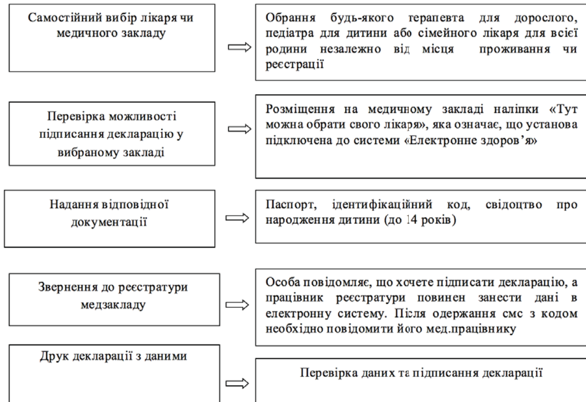
Рис. 2. Алгоритм підписання декларації з лікарем