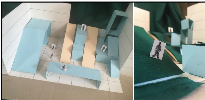
іл. 1. Практичне завдання (макет) курсу «Making Architecture»

Натомість курси «Making Architecture» та «Co-Creating Sustainable Cities» передбачають більш практичний підхід та певну необхідну кількість виконаних і перевічених робіт (іл. 1, іл. 2) за системою «peer review» на додачу до серії тестових питань.