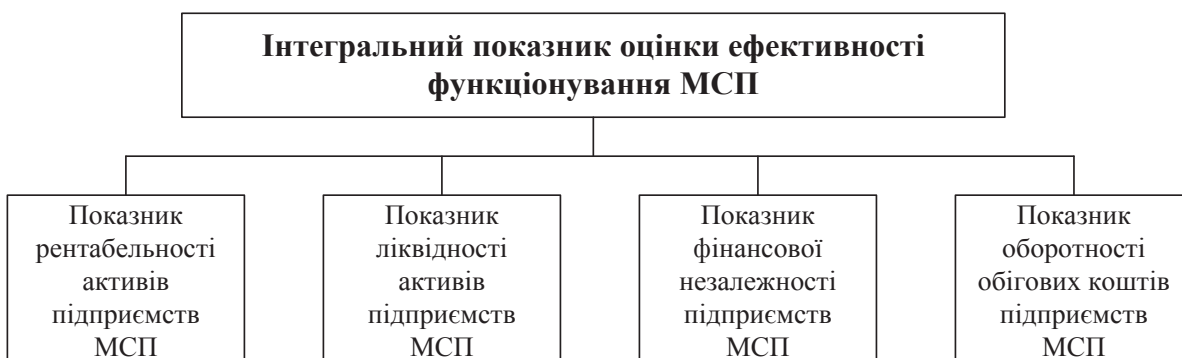
Рис. 1. Методичний підхід до оцінки ефективності функціонування МСП в цілому по економіці України та за ВЕД

Виходячи з цієї роботи пропонується його поширити на оцінку ефективності функціонування МСП як в цілому по економіці України, так і за видами економічної діяльності (ВЕД) за допомогою наступної системи показників рис. 1.