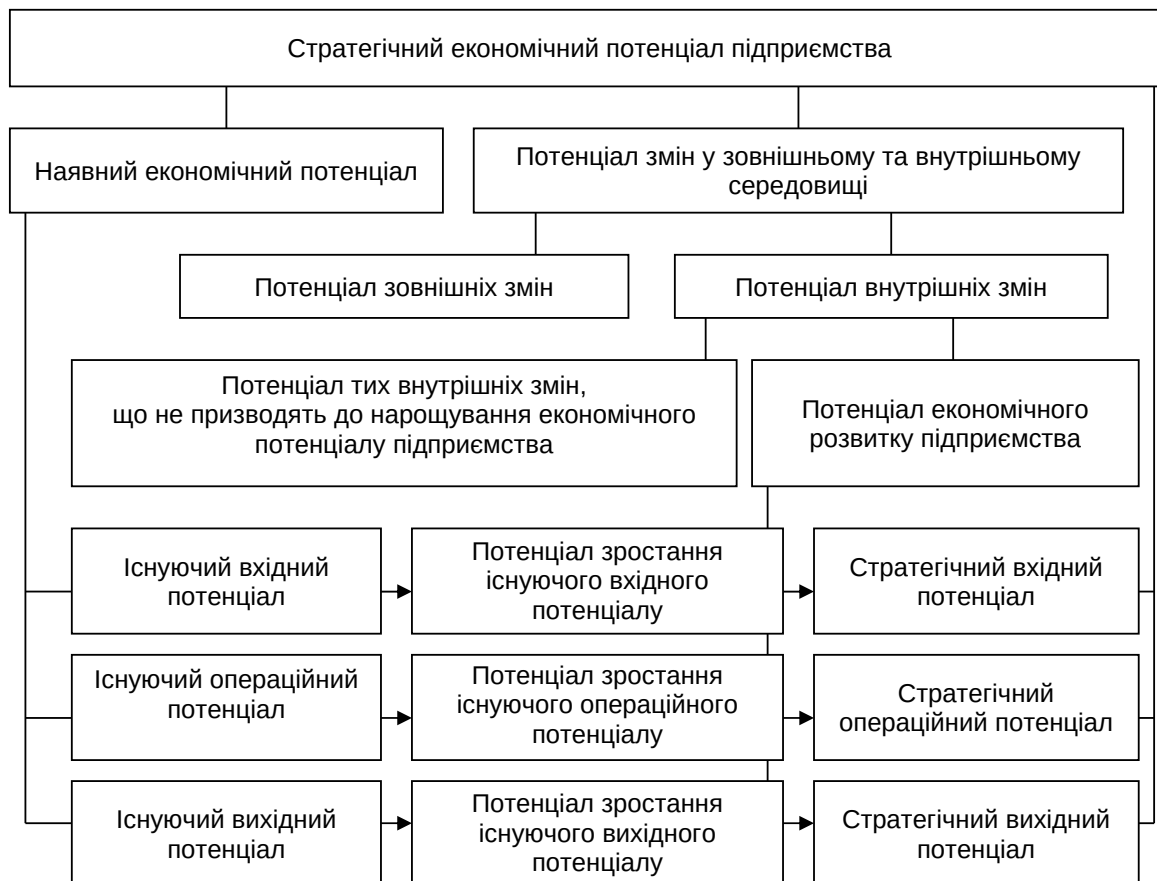
Рис. 1. Місце потенціалу економічного розвитку суб'єкта господарювання в ієрархії різновидів його економічного потенціалу