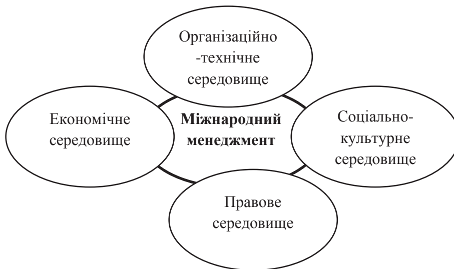
Рис. 2. Середовище міжнародного менеджменту

Характерні риси міжнародного менеджменту мають економічний, соціально-психологічний, правовий і організаційно-технічний аспекти. Перші два є комбінуванням складових саме управління, яка була розглянута нами вище. Виокремлення середовища міжнародного маркетингу зображено на Рис.2.