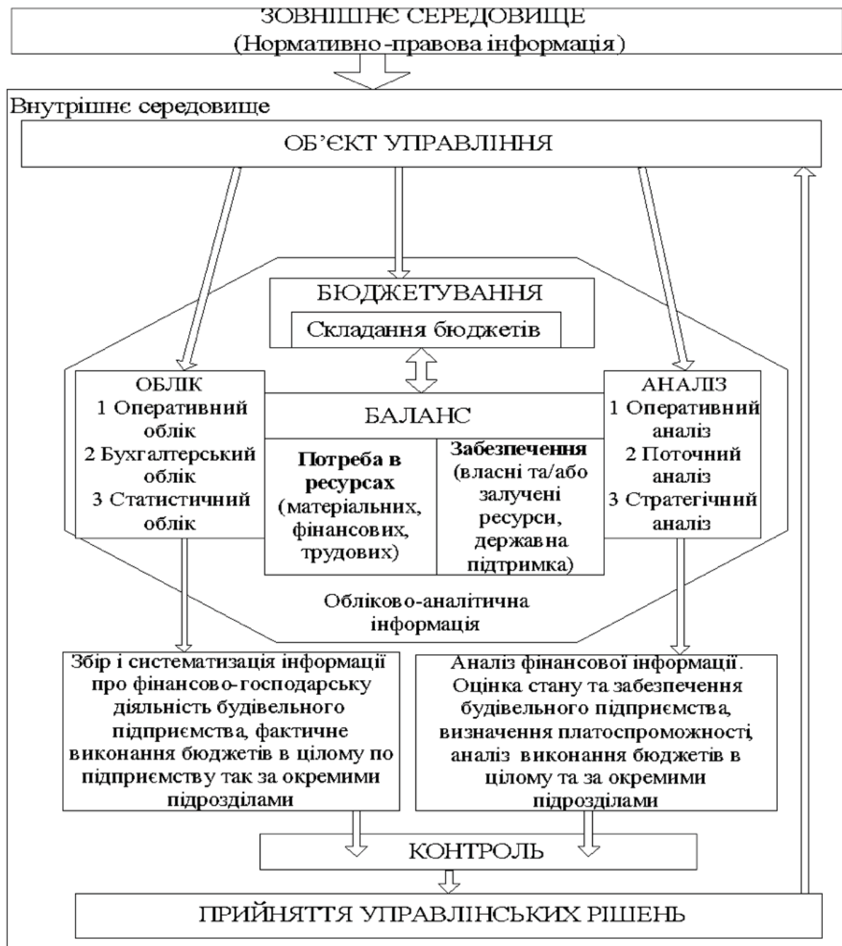
Рис. 2 – Процес формування обліково-аналітичного забезпечення бюджетування

Сучасна система обліково-аналітичного забезпечення бюджетування будівельних підприємств потребує нового сутнісного наповнення як комплексу взаємодіючих та взаємопов'язаних методів, методик, процедур і моделей, призначених для обґрунтування прийняття управлінських рішень у сфері забезпечення бюджетування підприємства.