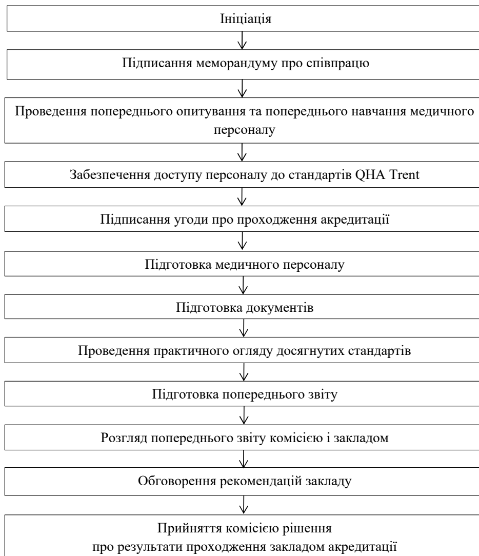
Рис. 3. Процедура проведення акредитації за стандартами QHA Trent

4. У Канаді існує система Accreditation Canada International (Міжнародна Канадська система акре-