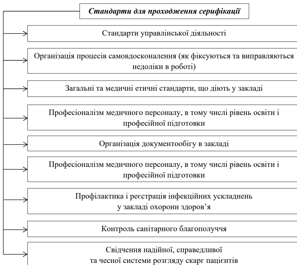
Рис. 2. Основні стандарти, за якими провадять акредитацію міжнародні організації