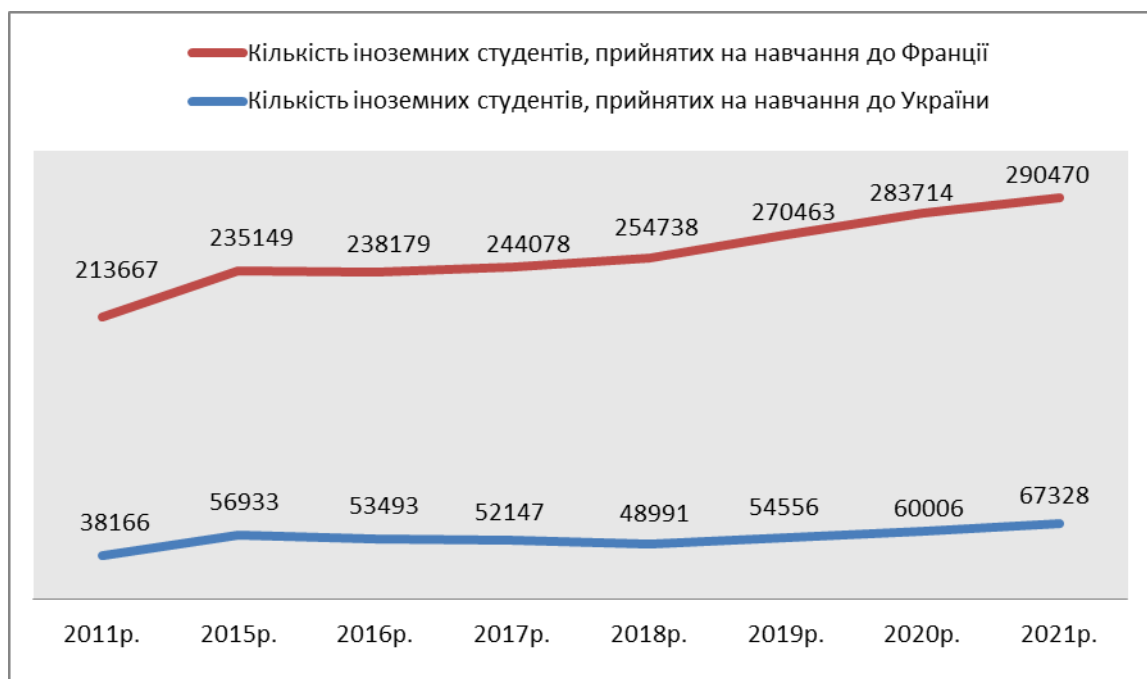
Динаміка зміни кількості іноземців, прийнятих до ЗВО України та Франції за останні 10 років (у період з 2011 – 2021 рр.)

*Діаграма складена на основі даних Державної служби статистики України [2] та Repères et références statistiques de France [10]