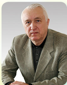
Доктор технічних наук, професор, завідувач кафедри Менеджменту, управління проектами і логістики