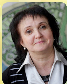
Старший викладач кафедри Архітектурного проектування та містобудування