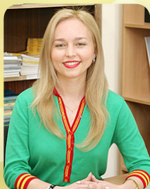
Викладач кафедри Іноземних мов

Реєкторат, профком, редакція газети «МБ», Студентська рада