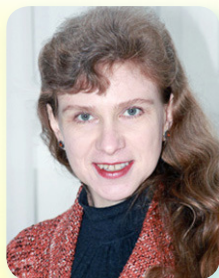
Викладач кафедри Іноземних мов та підготовки іноземних студентів