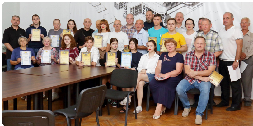
Спільне фото нагороджених з нагоди Дня будівельника