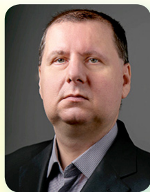
Заступник декана ф-ту ЦІтаЕ, асистент кафедри Опалення, вентиляції, кондиціонування та теплогазопостачання