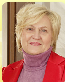
Кандидат економічних наук, доцент кафедри Девелопменту нерухомості, обліку та маркетингу