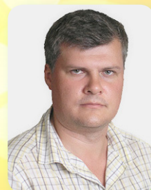
Доктор технічних наук, завідувач кафедри фундаментальних і природничих дисциплін