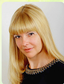
Кандидат технічних наук, доцент кафедри Організації і управління будівництвом