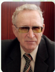
Доктор технічних наук, професор кафедри Експлуатації та ремонту машин