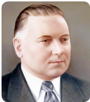
К. Ф. Стародубов (1904 – 1984)

Присвячується 118-річчю з дня народження д.т.н., професора, академіка АН УРСР, заслуженого діяча науки і техніки України К. Ф. Стародубова. «Яким є найважливіший урок з життя цієї видатної людини? К. Ф. Стародубов був людиною високої громадянської відповідальності. За будь-яких обставин він залишався самим собою, прямував до поставленої мети. Він мав особисту привабливість, непереборне бажання служити своєму народові, людям, прагненням прикрасити і полегшити їхнє життя. Так, Стародубови не повторюються. Але вчитися у великих людей мужності, цілеспрямованості, вірності своєму покликанню, моральній позиції, поняттям про обов'язок і честь потрібно, навіть, необхідно».