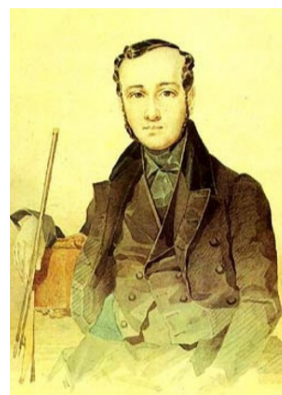
Портрет Євгена Павловича Гребінки, 1837