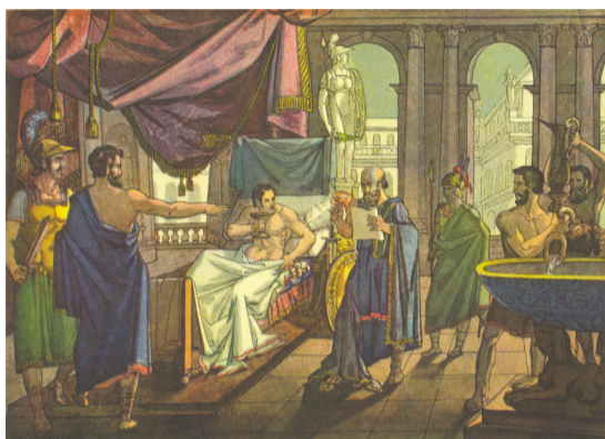
Александр Мекедонський виявляє довір'я своєму лікареві Філіппу, 1836