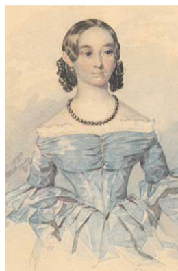
Портрет Катерини Абази, 1837