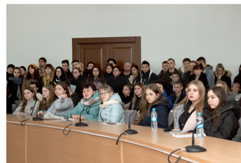
Абітурієнти були і веселими, і уважними слухачами