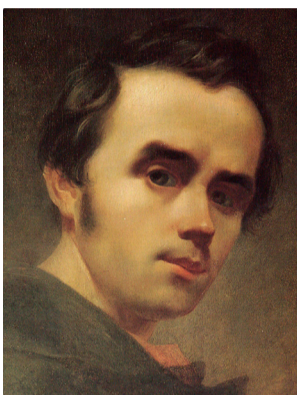
Т. Г. Шевченко. Автопортрет, 1840 – 1841