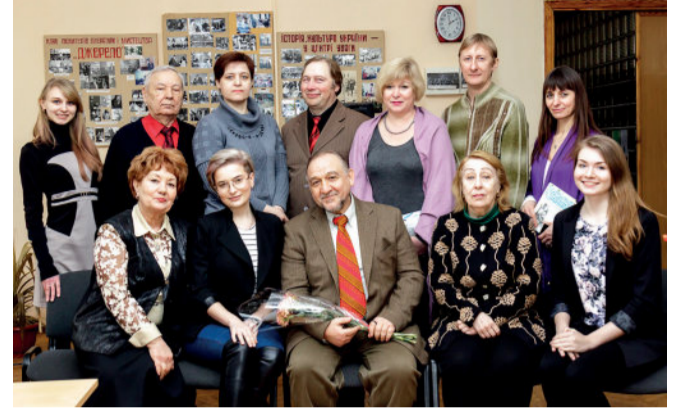
Участники поэтической встречи