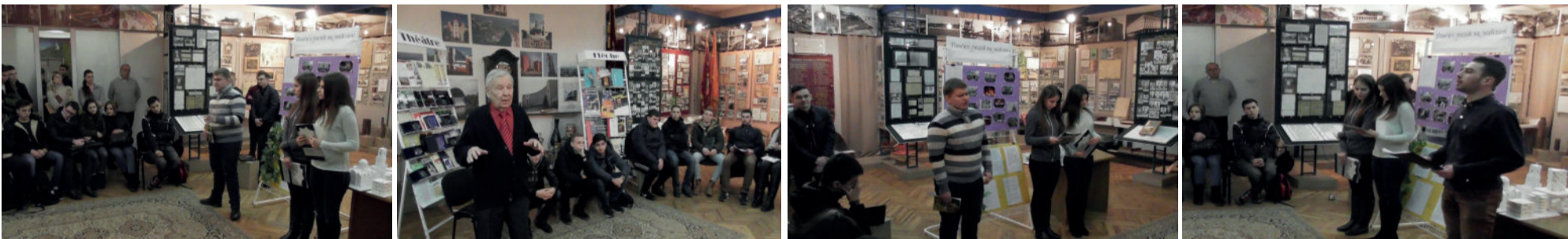
Хвилюючі моменти зустрічі в музеї академії