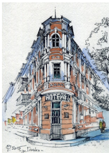
На розі вул. Глінки та Європейської площі