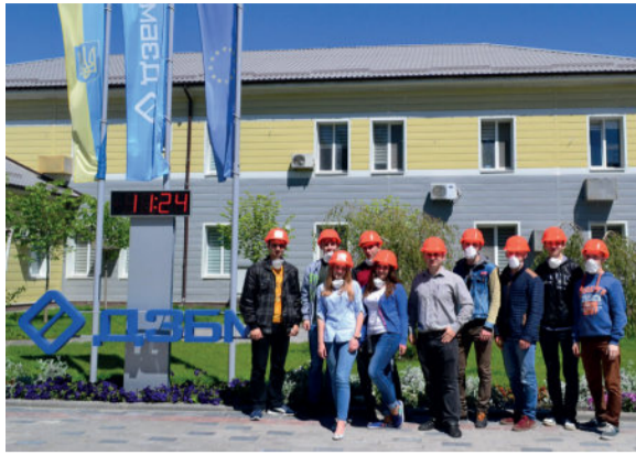
Студенти спеціальності «Автоматизація та комп'ютерно – інтегровані технології» на за Дніпровському заводі будівельних матеріалів

На Дніпровському заводі залізобетонних виробів студенти мали змогу оцінити сучасну лінію з виробництва стінових панелей, а також технологію виробництва різноманітних залізобетонних виробів. Особливу увагу зараз приділяється виготовленню конструкції для капітального ремонту нового моста у м. Дніпро.