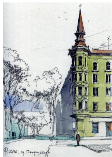
Будівля на проспекті Дмитра Яворницького