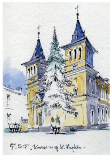
Костел на проспекті Дмитра Яворницького