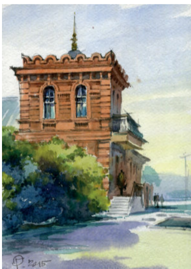
Дім Дмитра Івановича Яворницького