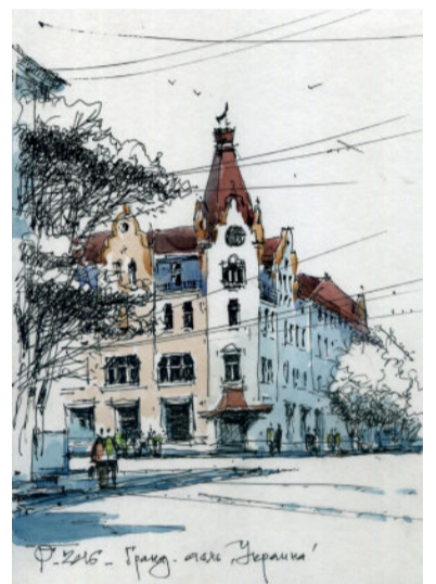
Град Готель Україна, просп. Д. І. Яворницького

Побувавши на чудовому вернісажі Олега Гаврилова кожній глядач, в тому числі і студенти архітектурного факультету, отримали не тільки естетичне задоволення, а і урок патріотизму – любові до свого рідного міста.