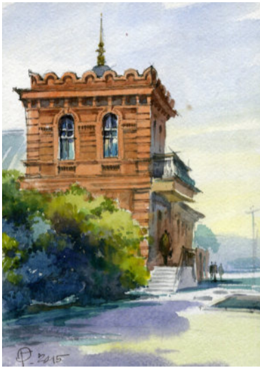
Дім Дмитра Івановича Яворницького