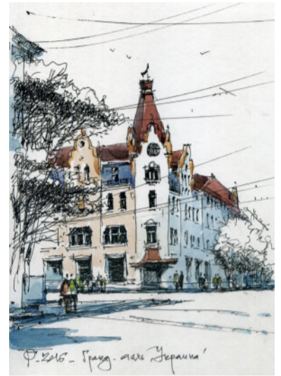
Град Готель Україна, просп. Д. І. Яворницького

Побувавши на чудовому вернісажі Олега Гаврилова, кожній глядач, в тому числі і студенти архітектурного факультету, отримали не тільки естетичне задоволення, а і урок патріотизму – любові до свого рідного міста.