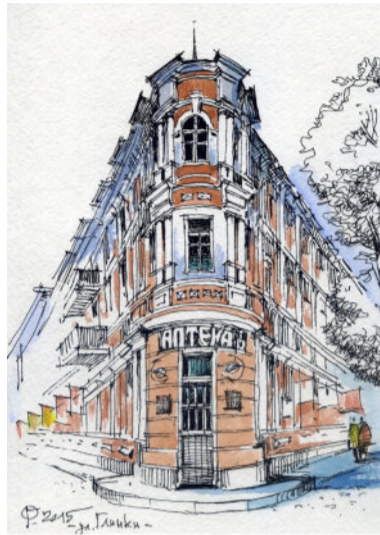
На розі вул. Глінки та Європейської площі