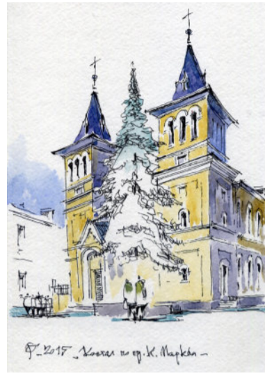
Костел на проспекті Дмитра Яворницького