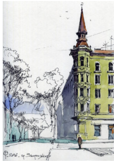
Будівля на проспекті Дмитра Яворницького