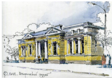
Ф.2014 - Исторический музей