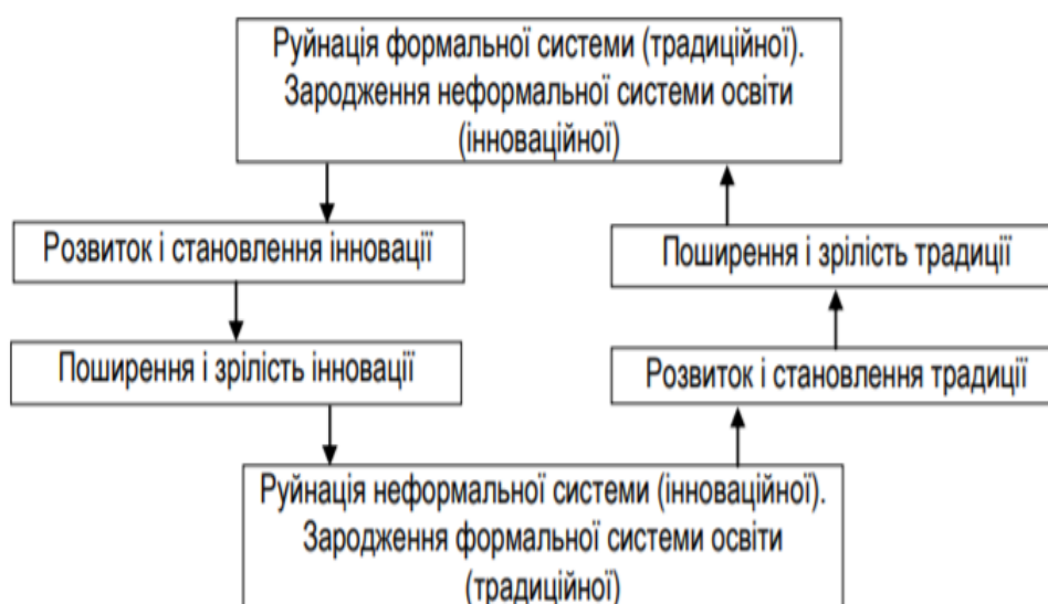
Рисунок 2. Діалектика взаємоперетворень інновацій і традицій

І. Дичківською було проаналізовано відмінності між стабільними й інноваційними процесами в освіті. Неформальна освіта за переважною частиною виділених дослідницею характеристик є інноваційним педагогічним процесом, який відзначається спрямованістю на задоволення нових суспільних потреб, необхідністю вироблення й апробації шляхів досягнення освітніх цілей, перервністю, довгостроковістю й низькою керованістю, гнучкістю.